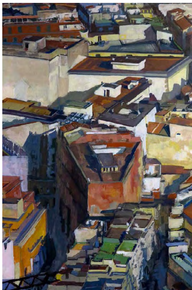
Sulla città - Naples Pascale Hémary Peinture à l'émulsion sur papier 81 x 47 cm 2019