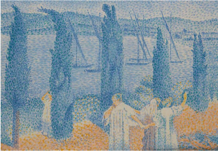
La Promenade ou Les Cyprés Henri-Edmond Cross lithographie, 28 x 33 cm 1897

L'ESTAMPE DANS TOUS SES ÉTATS DE DÜRER À PICASSO : TECHNIQUES ET ENQUÊTES