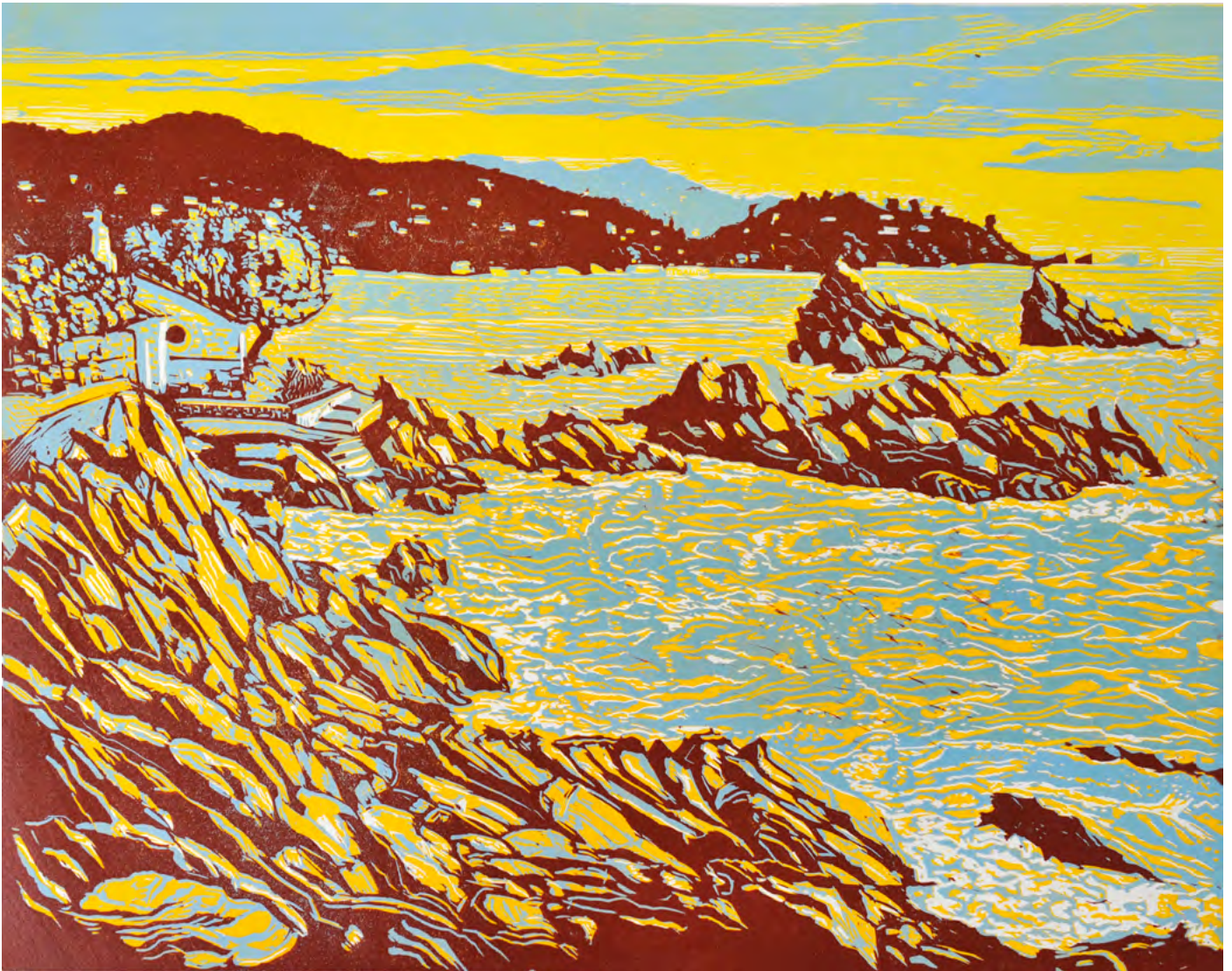
Les rochers de Saint-Clair Pascale Hémary linogravure en trois couleurs, 47 x 64 cm 2022