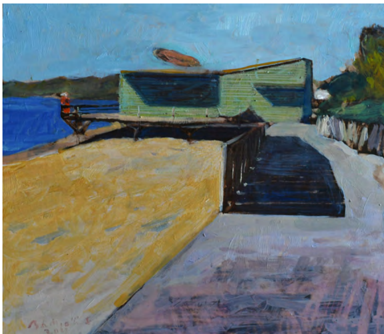
Californian Spirit Bertrand de Miollis huile sur panneau, 28 x 33 cm 2021