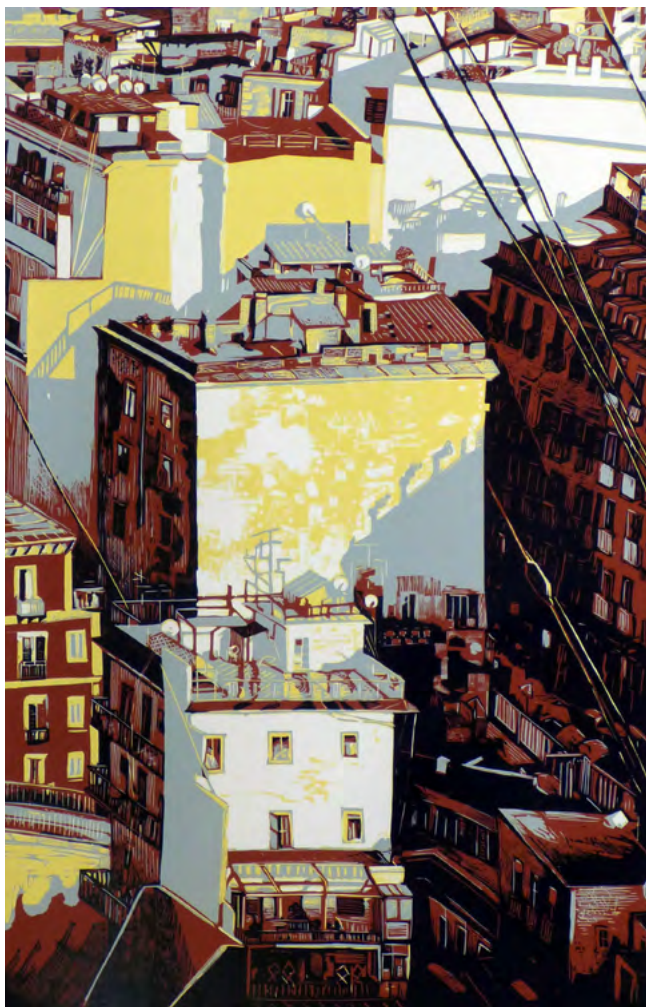
Sur Naples Pascale Hémary Linogravure en quatre couleurs sur papier vélin blanc 100 x 70 cm 2018