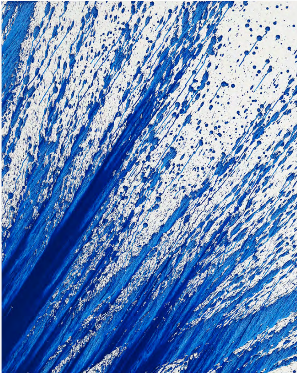
Portrait d'eau 210316, Chae Sung-Pil pigments naturels sur toile / natural pigments on canvas h.162 x l.130 cm / h.63.78 x w.51.19 in 2021