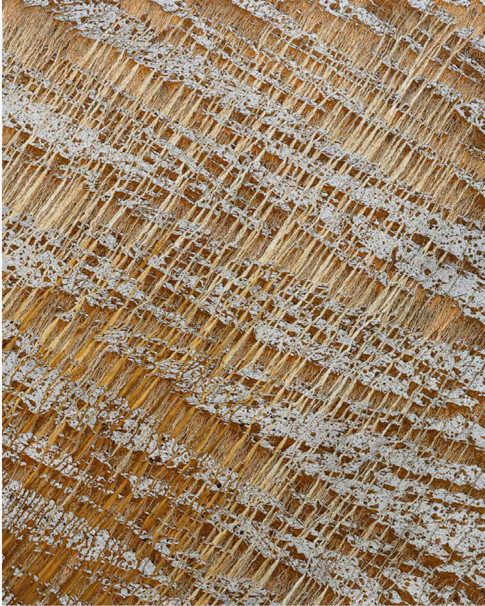
Terre anonyme 230120, Chae Sung-Pil pigments naturels sur toile / natural pigments on canvas h.162 x l.130 cm / h.63.78 x w.51.19 in 2023