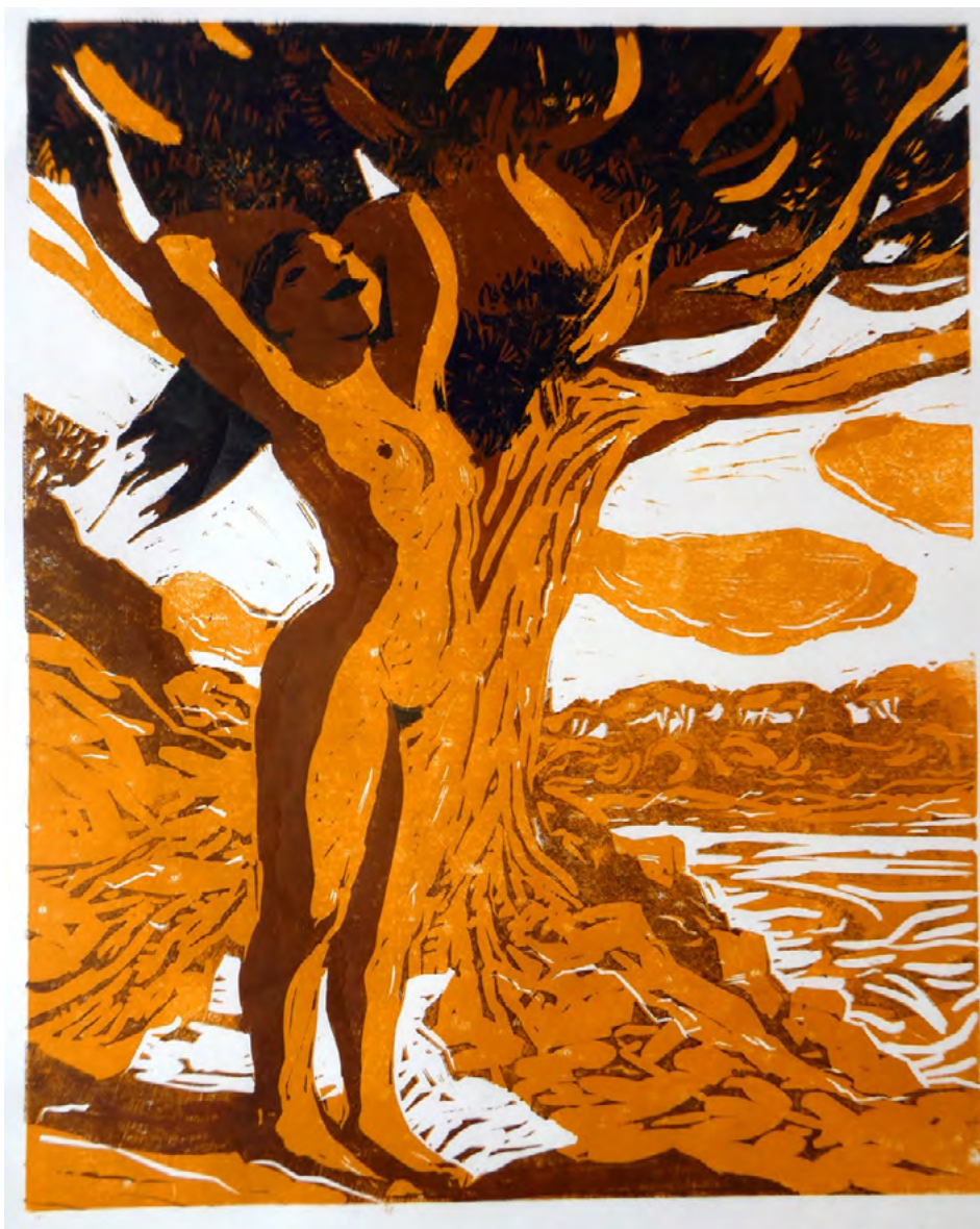
Eve-Sève, estampe, Bertrand de Miollis