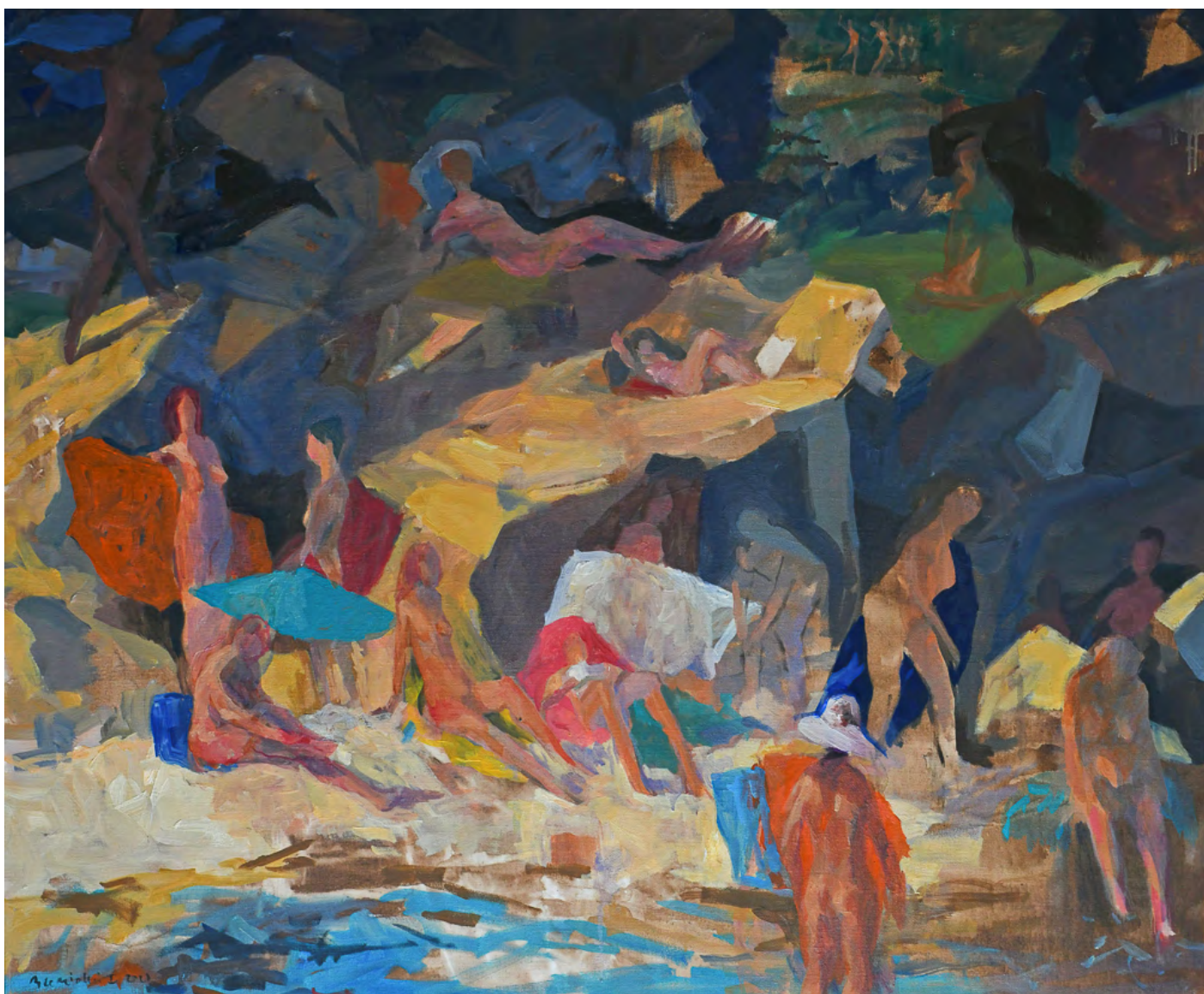
L'âge d'or du Layet, peinture, Bertrand de Miollis