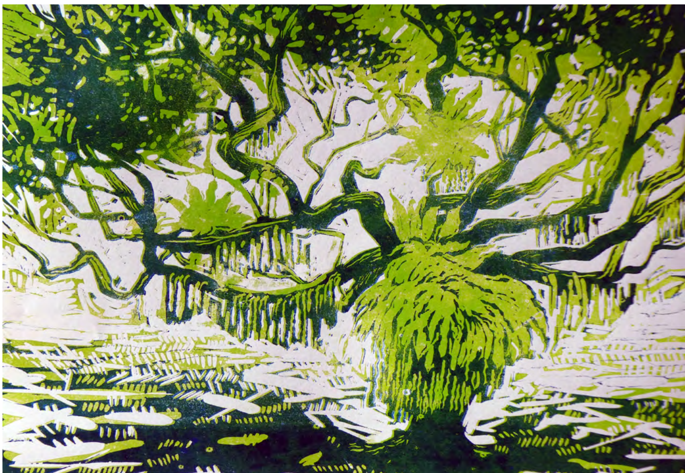
Vegetal octopus, estampe, Bertrand de Miollis