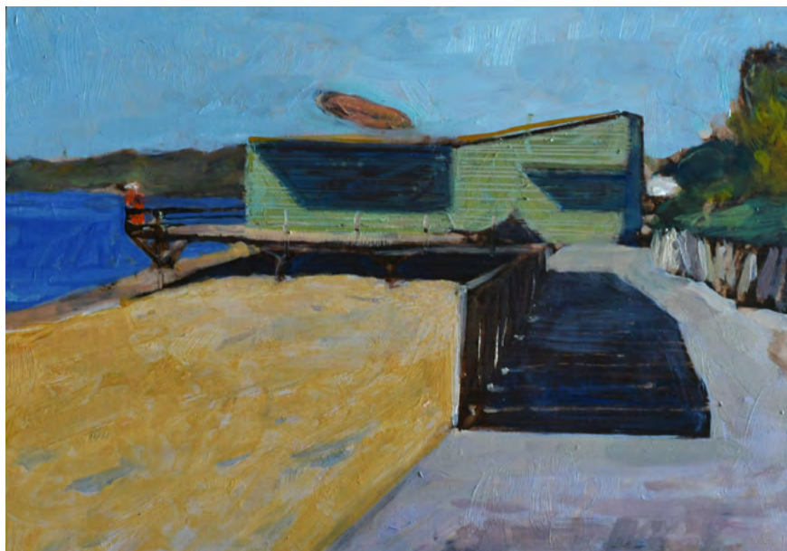
Californian Spirit, peinture, Bertrand de Miollis