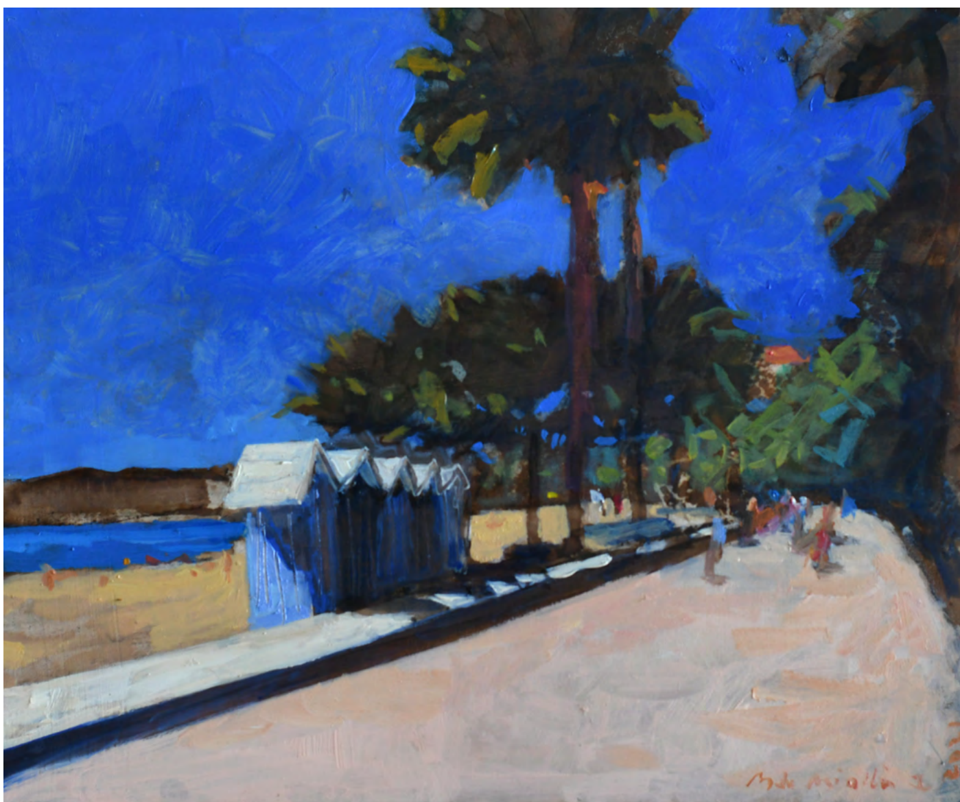
Les cabanes, peinture, Bertrand de Miollis

JEUDI 16 JUIN - DIMANCHE 3 JUILLET 2022 56, BD DE LA TOUR-MAUBOURG - PARIS VIIÈME