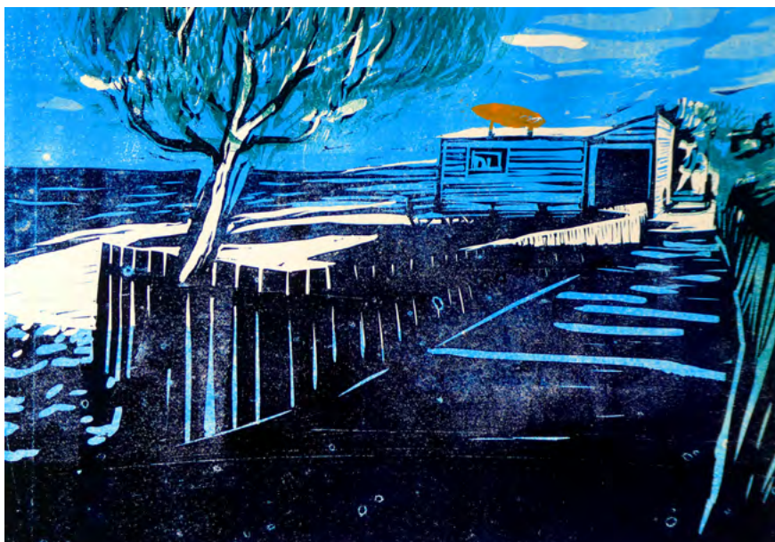
En attendant la vague, estampe, Bertrand de Miollis