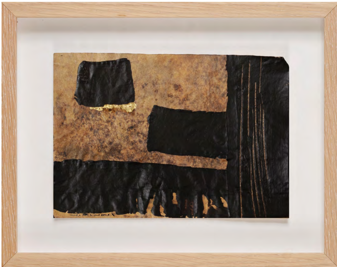
212 / Jean Bijoux acrylique et feuille d'or sur vélin, 2021 16 x 23 cm