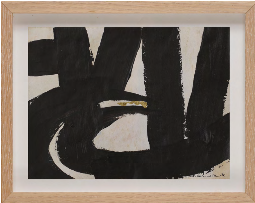
210 / Jean Bijoux acrylique et feuille d'or sur vélin, 2021 20 x 26,5 cm