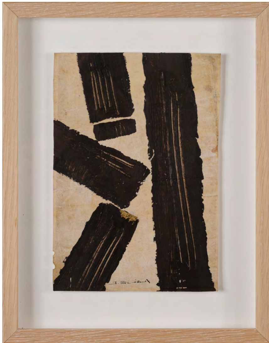
208 / Jean Bijoux acrylique et feuille d'or sur panneau, 2021 23 x 16 cm