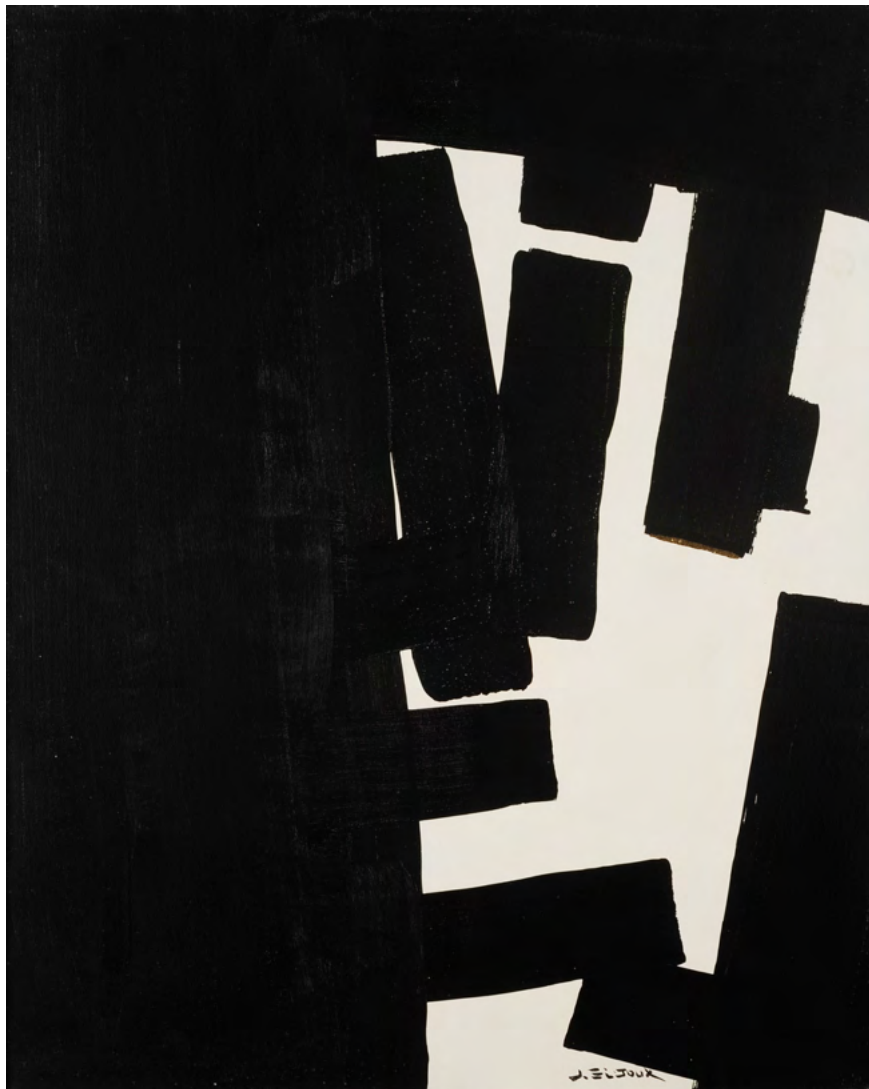
226 / Jean Bijoux acrylique et feuille d'or sur toile, 2021 81 x 65 cm