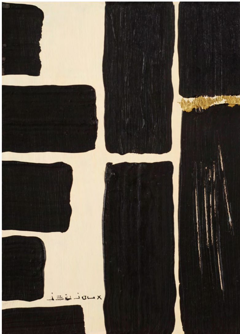
205 / Jean Bijoux acrylique et feuille d'or sur panneau, 2021 22 x 16 cm