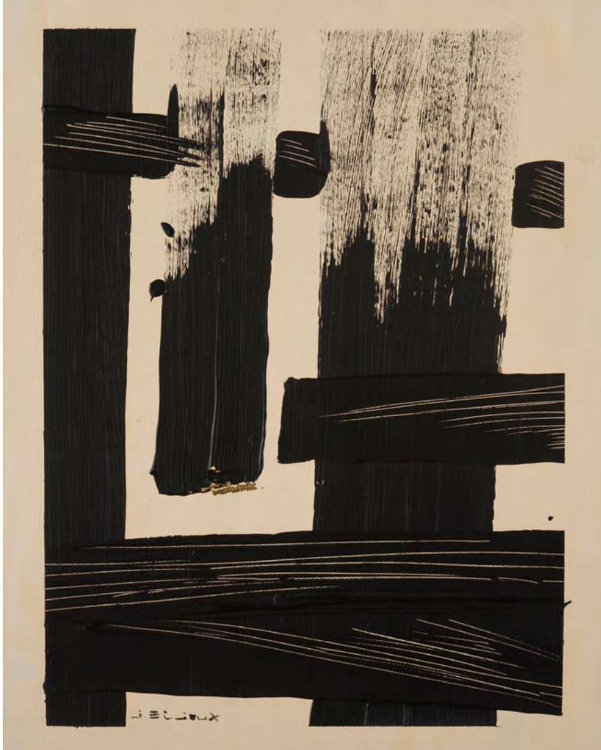
224 / Jean Bijoux acrylique et feuille d'or sur toile, 2021 77,5 x 60 cm