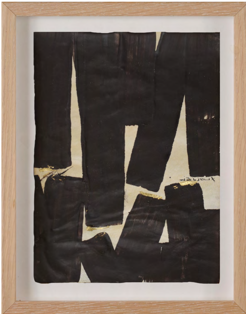
213 / Jean Bijoux acrylique et feuille d'or sur vélin, 2021 26,5 x 20 cm