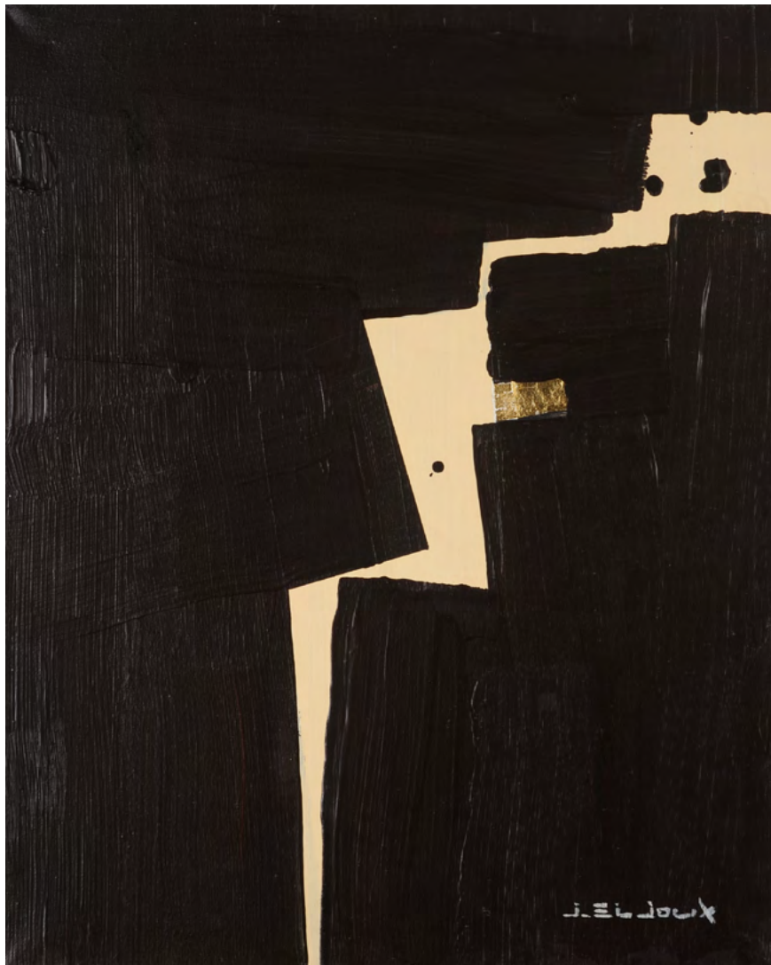
218 / Jean Bijoux acrylique et feuille d'or sur toile, 2021 50 x 40 cm