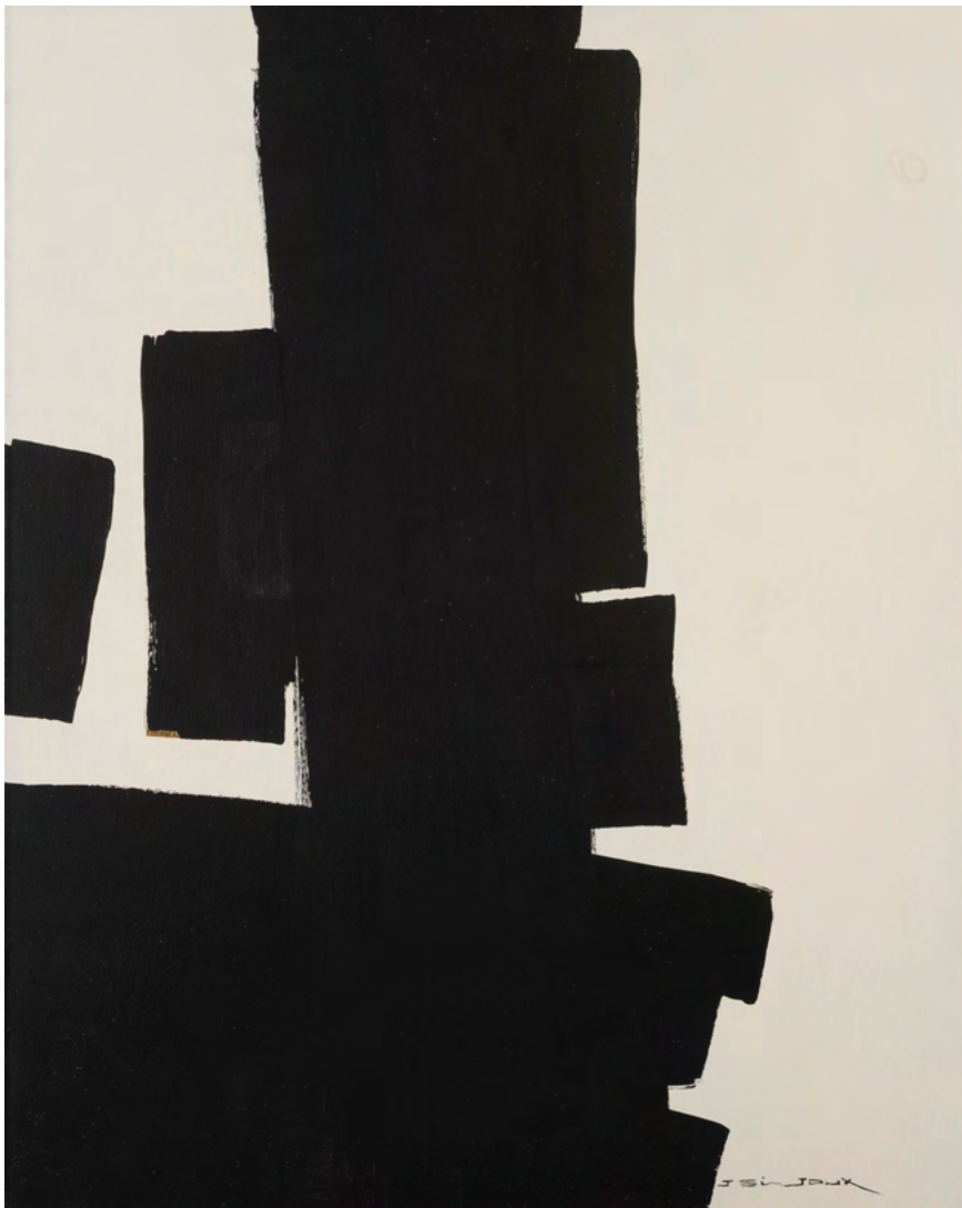
221 / Jean Bijoux acrylique et feuille d'or sur toile, 2021 81 x 65 cm