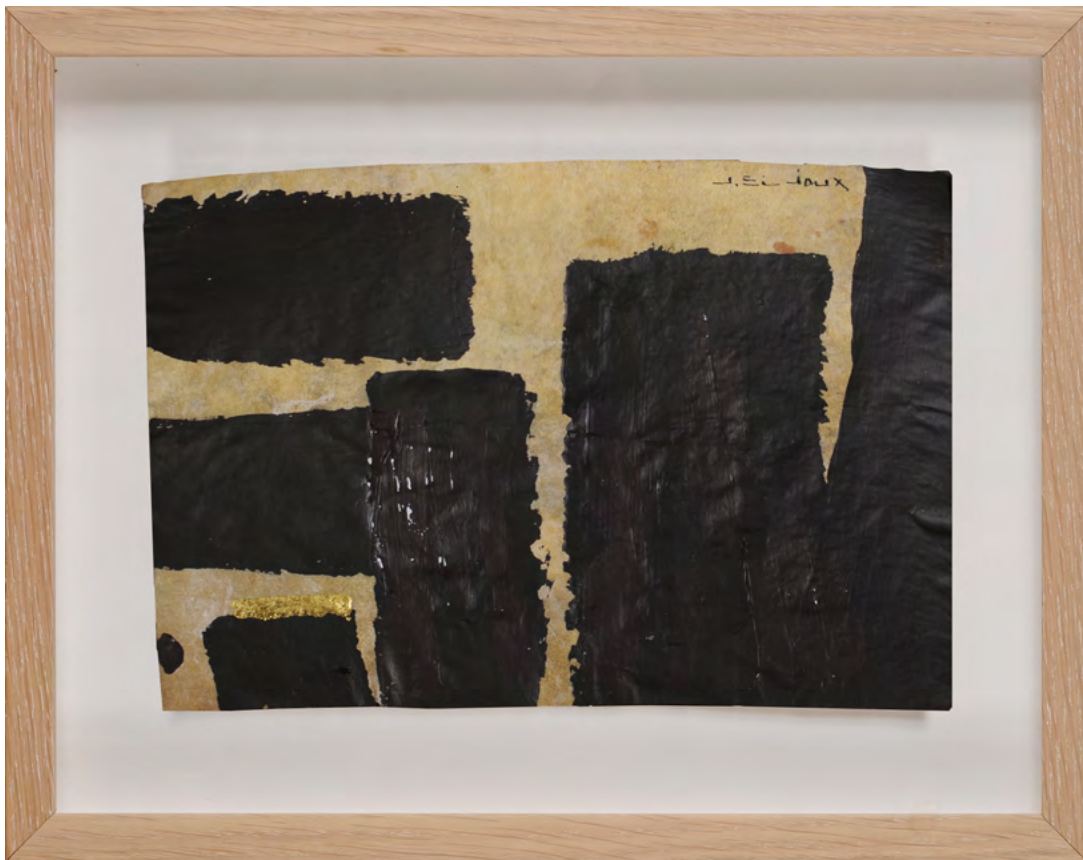
214 / Jean Bijoux acrylique et feuille d'or sur vélin, 2021 16 x 23 cm