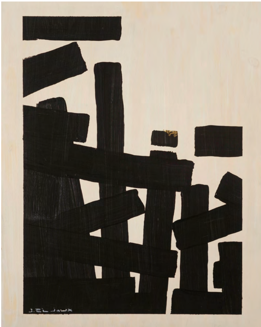
225 / Jean Bijoux acrylique et feuille d'or sur toile, 2021 77,5 x 60 cm