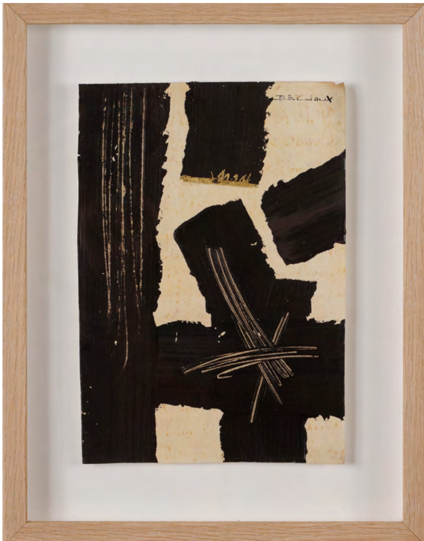
209 / Jean Bijoux acrylique et feuille d'or sur vélin, 2021 23 x 16 cm