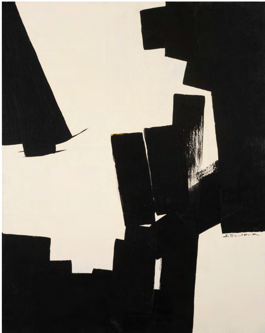
220 / Jean Bijoux acrylique et feuille d'or sur toile, 2021 81 x 65 cm