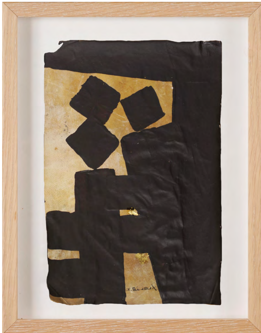
211 / Jean Bijoux acrylique et feuille d'or sur vélin, 2021 27 x 18 cm