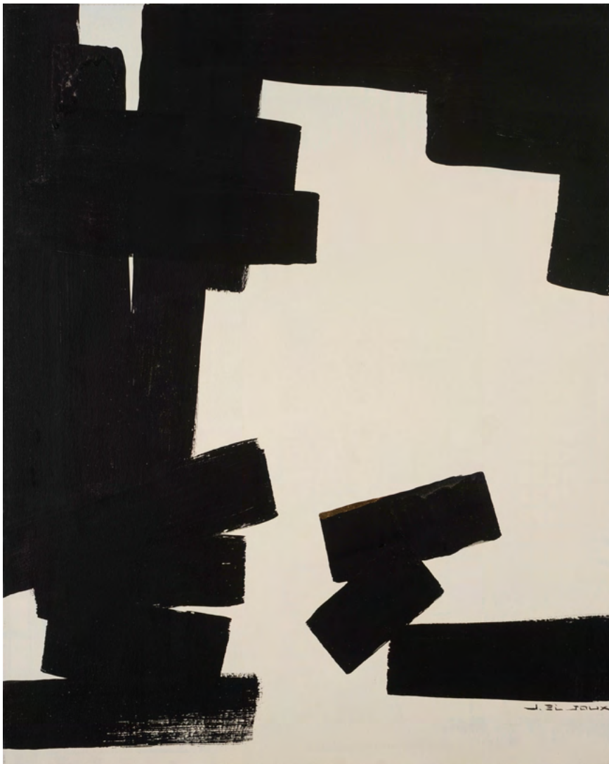
223 / Jean Bijoux acrylique et feuille d'or sur toile, 2021 81 x 65 cm