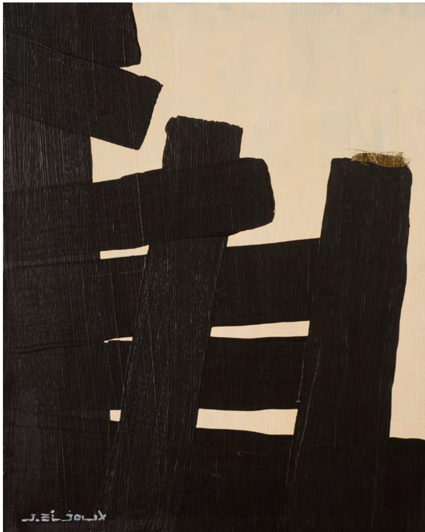
219 / Jean Bijoux acrylique et feuille d'or sur toile, 2021 50 x 40 cm