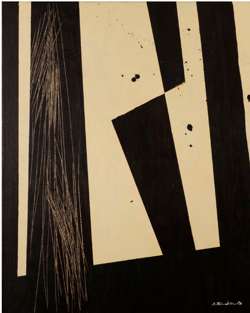
227 / Jean Bijoux acrylique et feuille d'or sur toile, 2021 100 x 81 cm