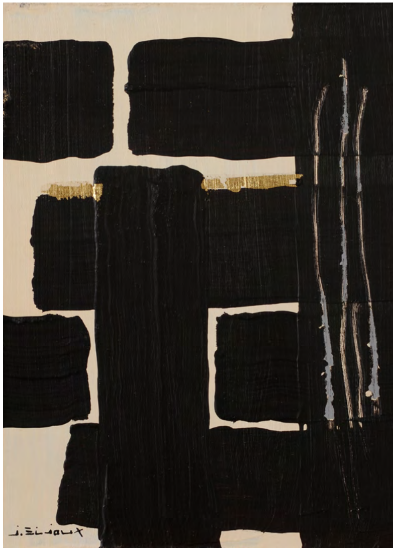
207 / Jean Bijoux acrylique et feuille d'or sur panneau, 2021 22 x 16 cm