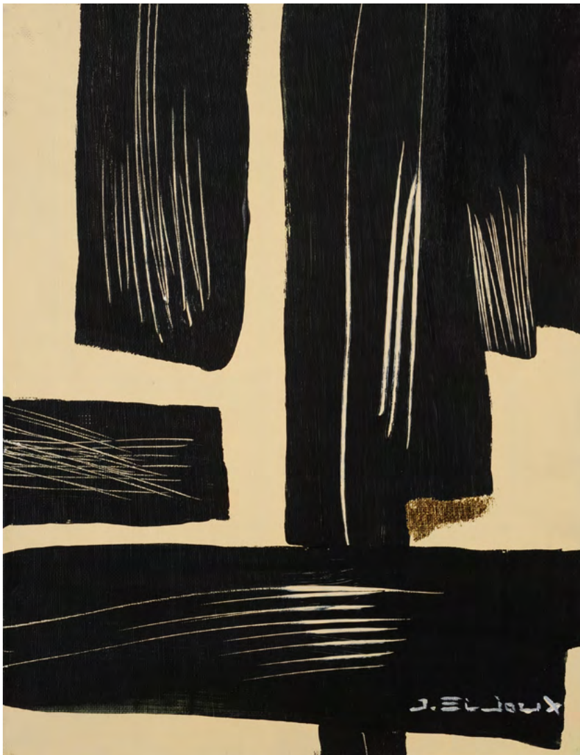
217 / Jean Bijoux acrylique et feuille d'or sur toile, 2021 35 x 27 cm