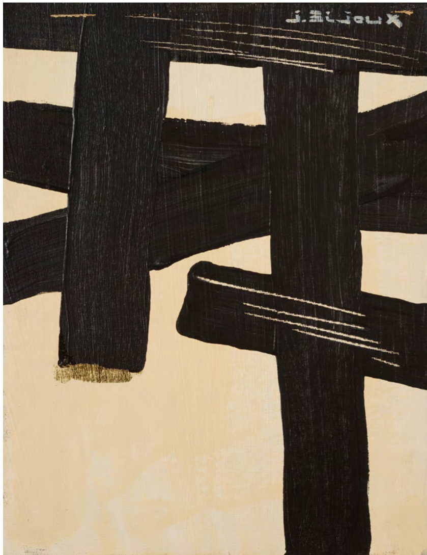
216 / Jean Bijoux acrylique et feuille d'or sur toile, 2021 35 x 27 cm