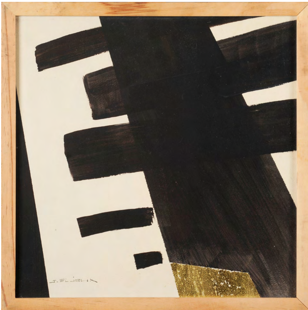
215 / Jean Bijoux acrylique et feuille d'or sur papier, 2021 30 x 30 cm