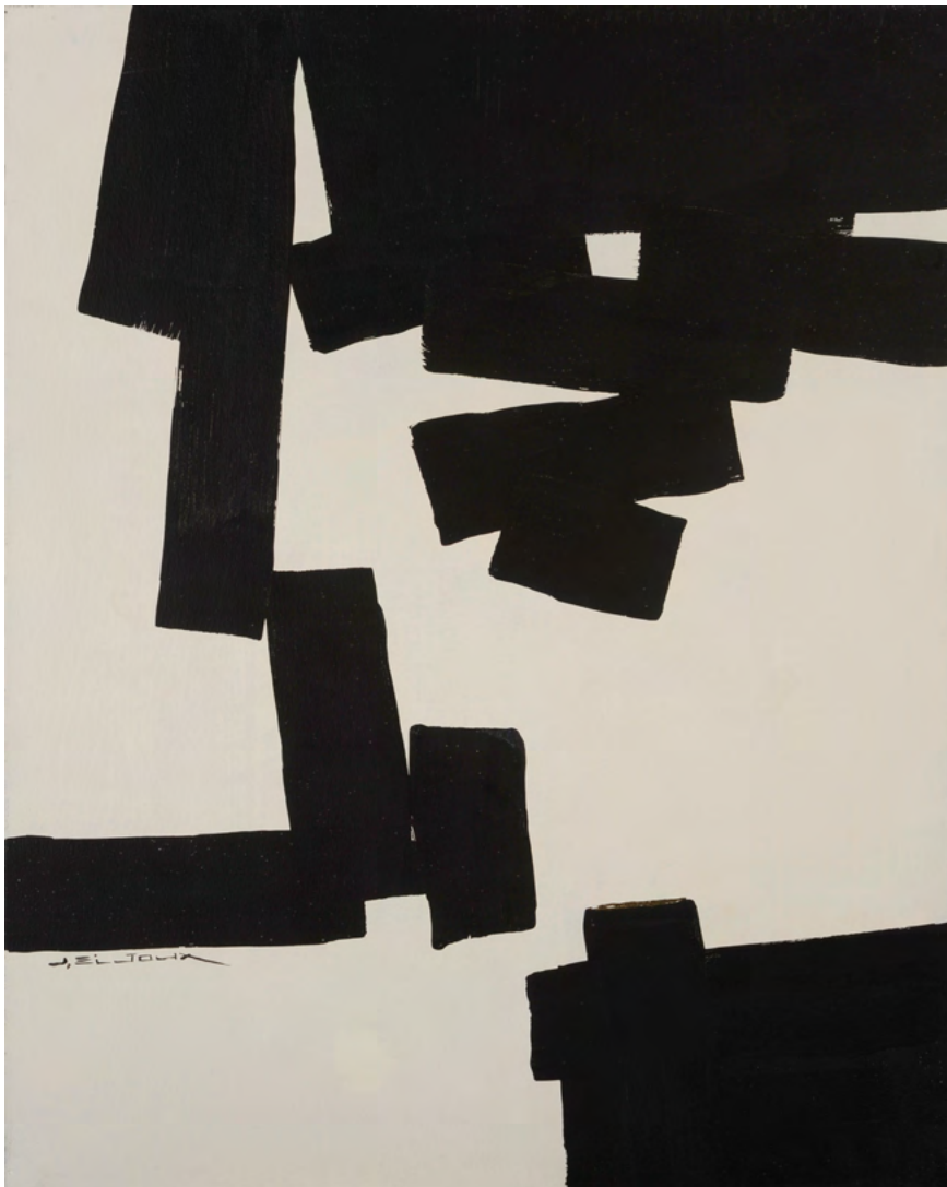
222 / Jean Bijoux acrylique et feuille d'or sur toile, 2021 81 x 65 cm